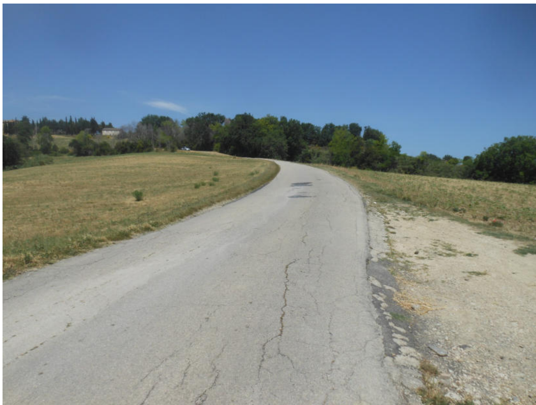
FOTO N° 7: S.P. 203 “Corta per Torre San Patrizio” oggetto dei lavori.