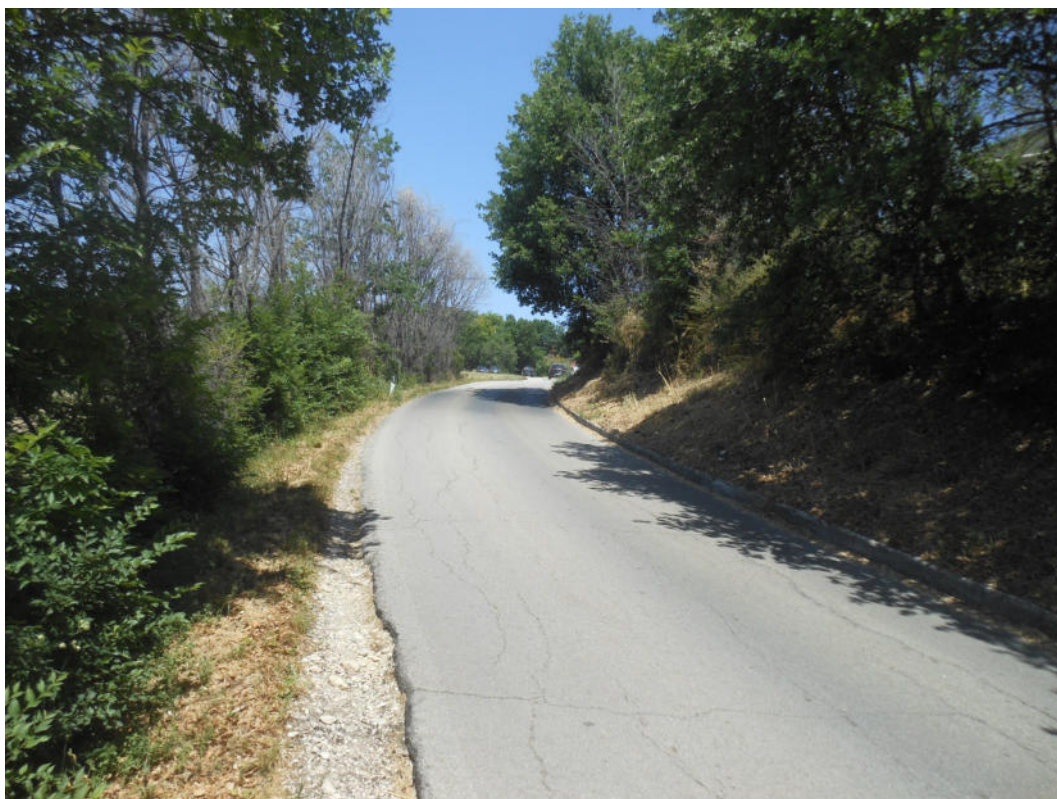
FOTO N° 6: S.P. 203 “Corta per Torre San Patrizio” oggetto dei lavori.