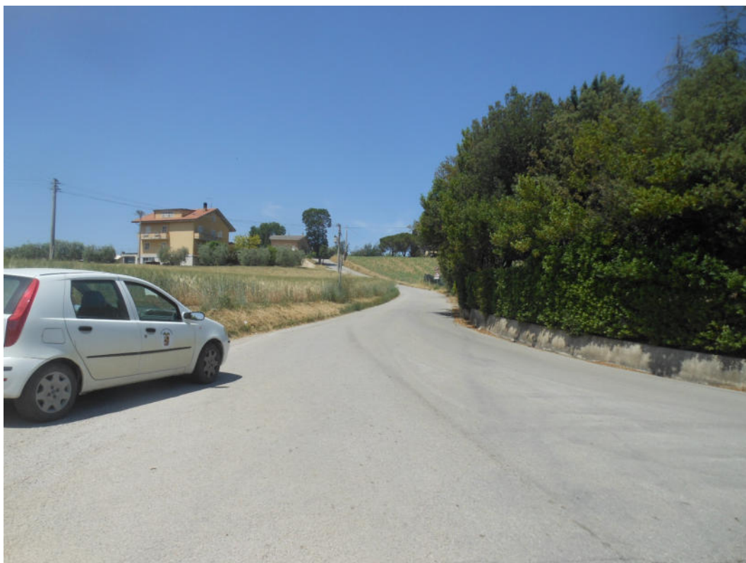
FOTO N° 3: S.P. 203 “Corta per Torre San Patrizio” oggetto dei lavori.