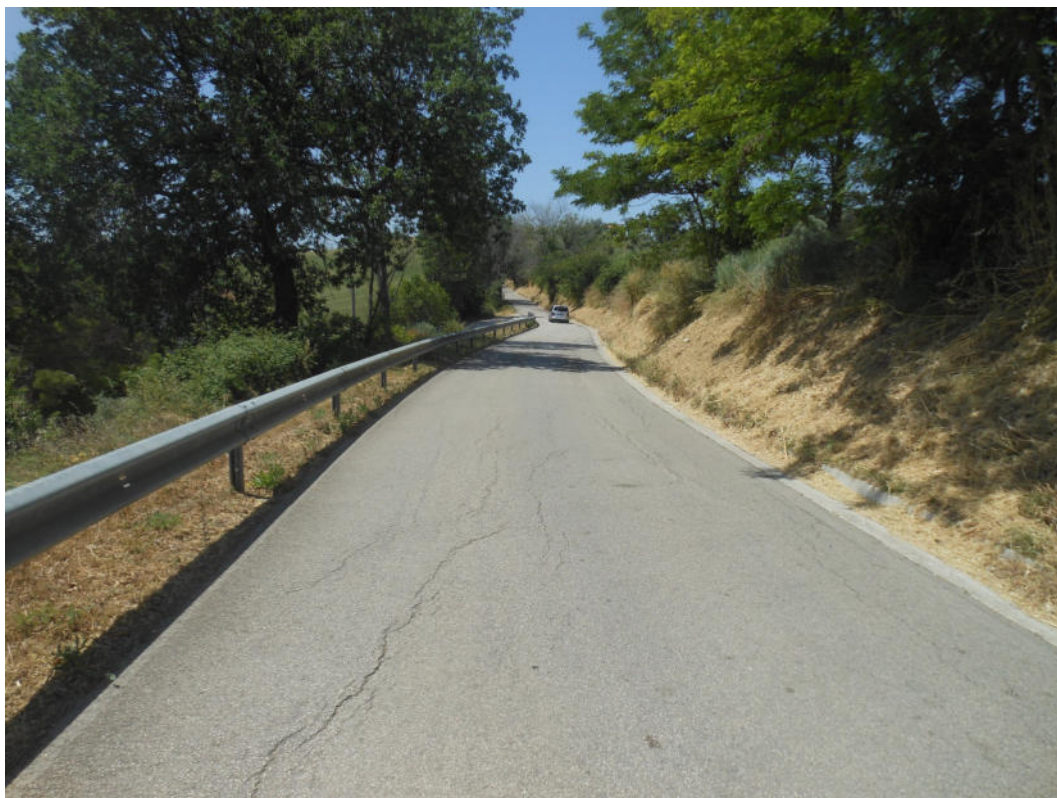
FOTO N° 9: S.P. 203 “Corta per Torre San Patrizio” oggetto dei lavori.