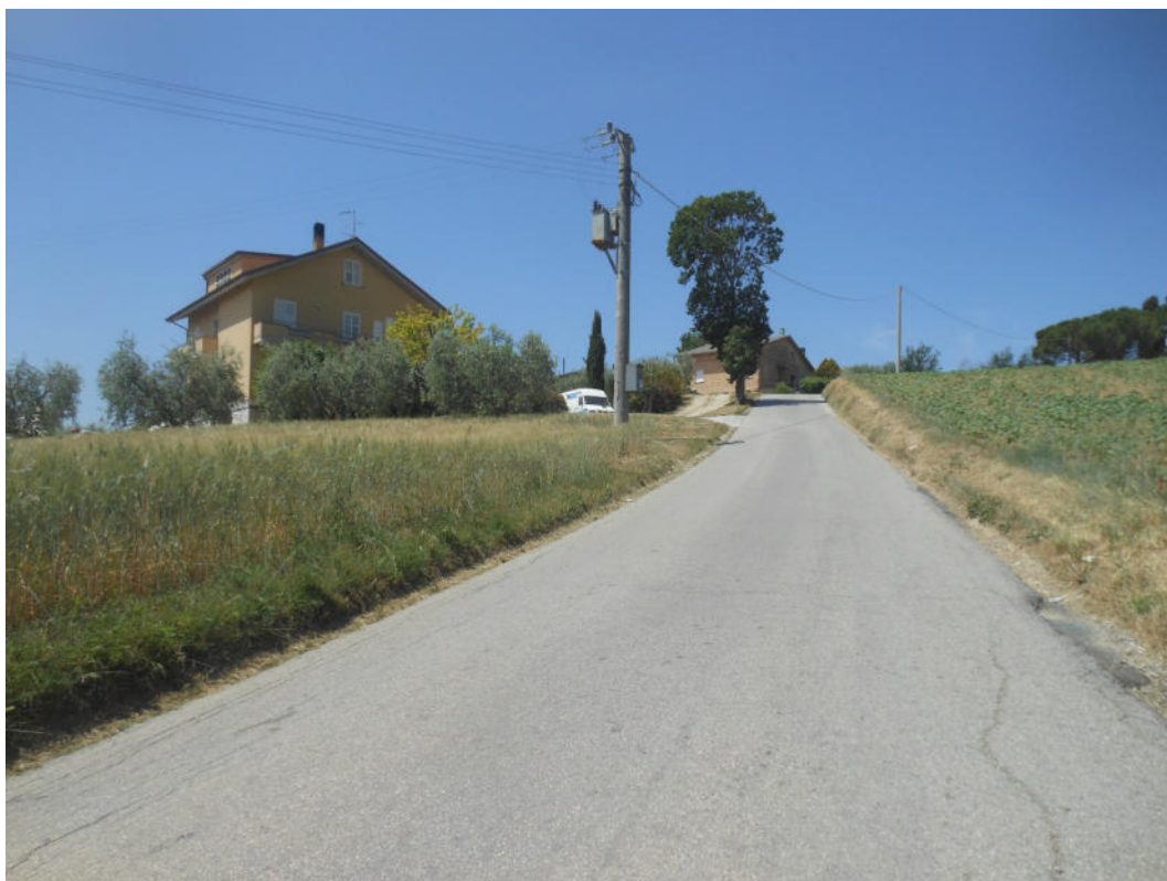
FOTO N° 4: S.P. 203 “Corta per Torre San Patrizio” oggetto dei lavori.