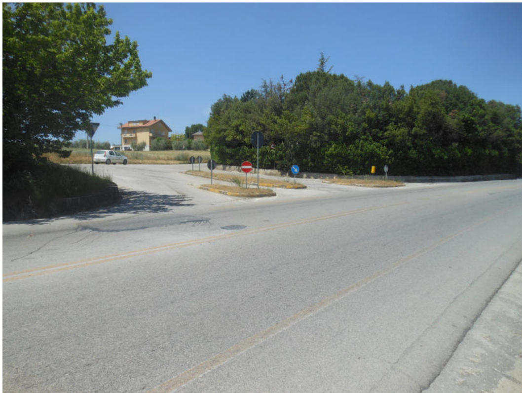
FOTO N° 1: Innesto tra la S.P. 203 “Corta per Torre San Patrizio” e la S.P. 219 “Ete Morto” Mezzina.