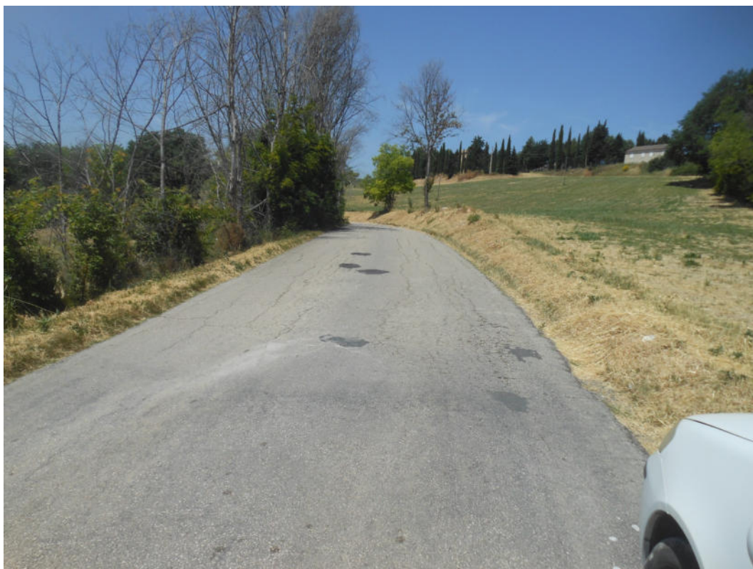
FOTO N° 8: S.P. 203 “Corta per Torre San Patrizio” oggetto dei lavori.