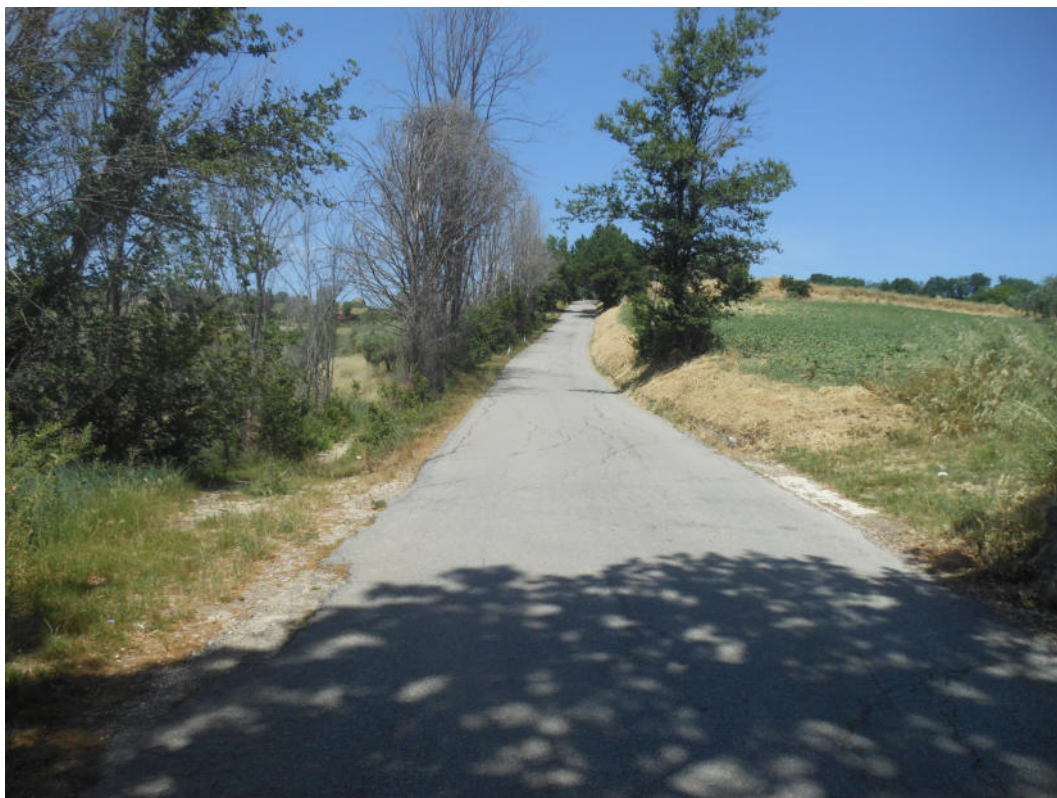
FOTO N° 5: S.P. 203 “Corta per Torre San Patrizio” oggetto dei lavori.