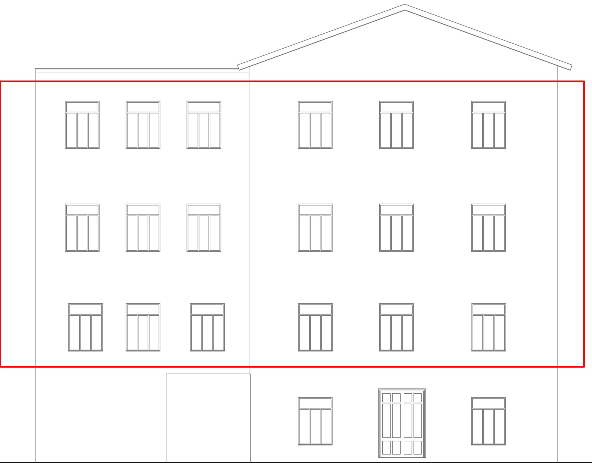
STATO DI FATTO_PROSPETTO EST