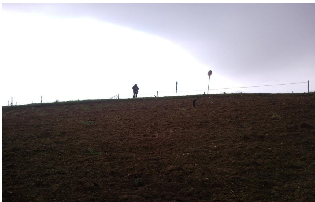
Foto 4 - Vista dell' area dal basso verso la strada principale.