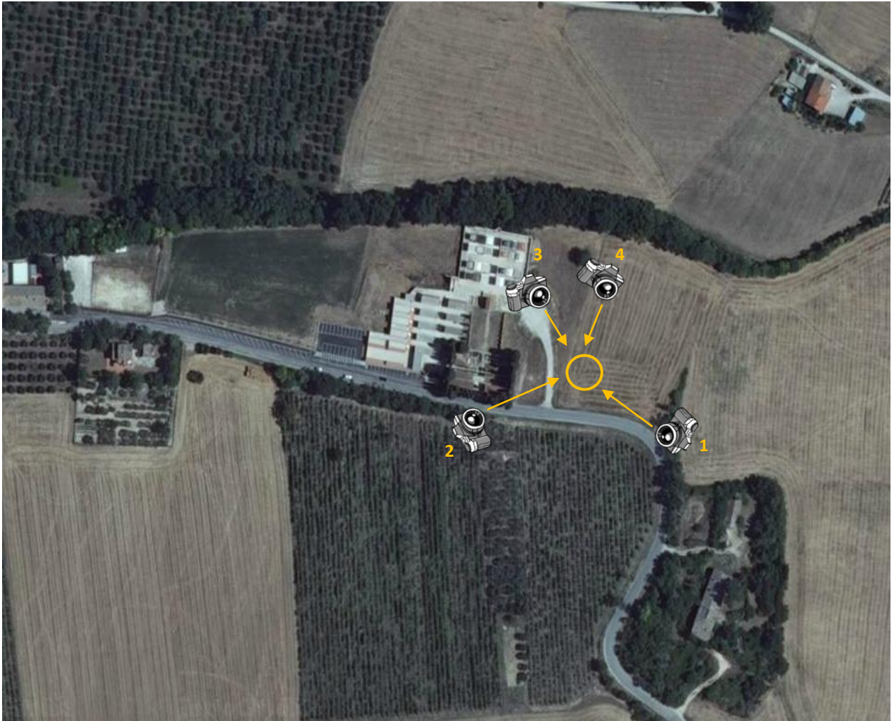
Planimetria dell'inquadratura fotografico – cerchiata in giallo l'area di intervento