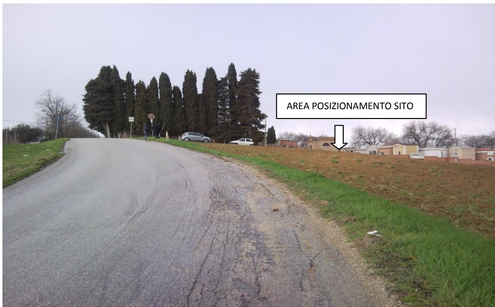
FOTO 1 - Vista dell'area di installazione dalla strada principale in prossimità della curva.