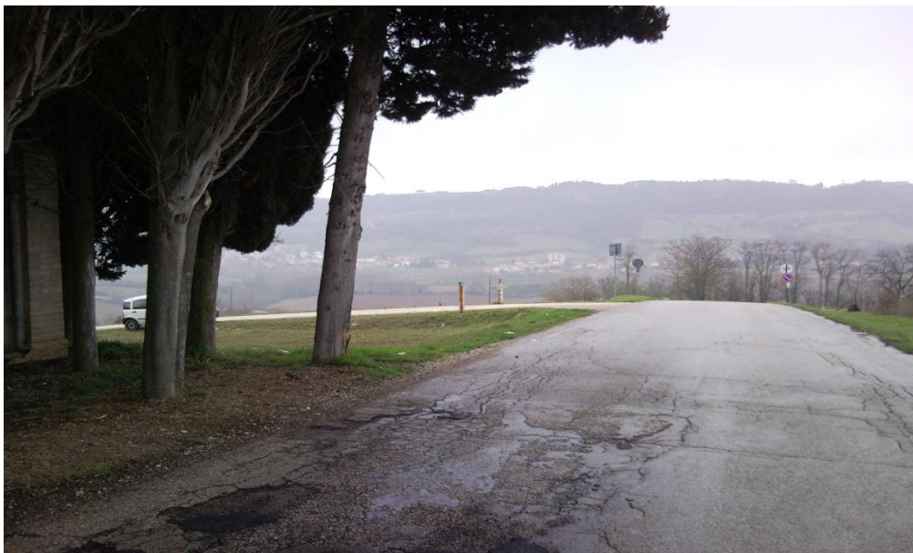
Foto 2 - Vista dell'area dalla strada principale in prossimità dello spigolo sud del cimitero.