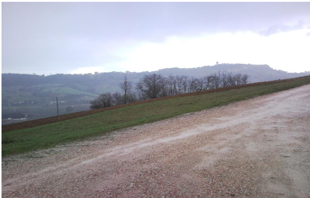
Foto 3 - Vista dell' area dal piazzale davanti l' ingresso del cimitero.