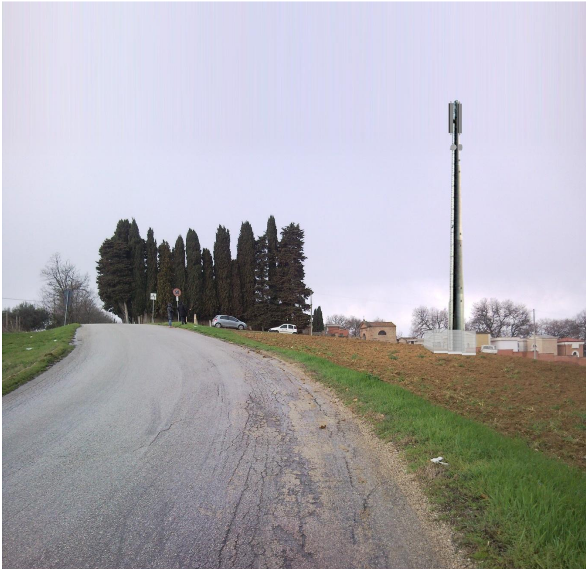
Simulazione intervento dalla strada principale in prossimità della curva.