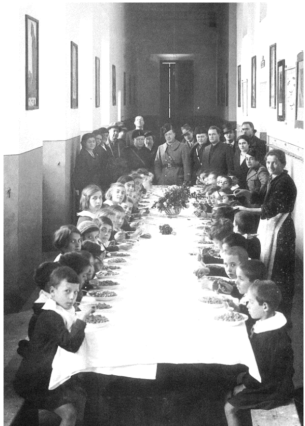
05 – Corridoio e refettorio. Anni '30