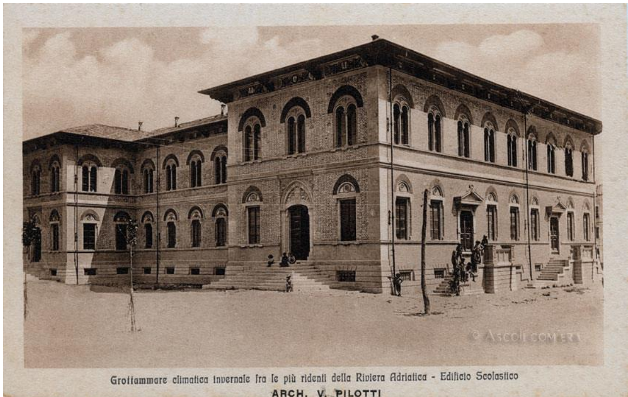
01 - Cartolina Anni '20