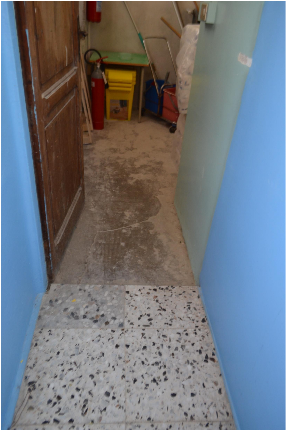
Foto 31 – Interno ala Est, ripostiglio adiacente ascensore, Piano Terra,