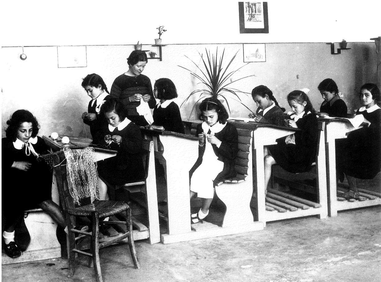
06 – Esperimento di lavoro in classe. Anno scolastico 1939/1940