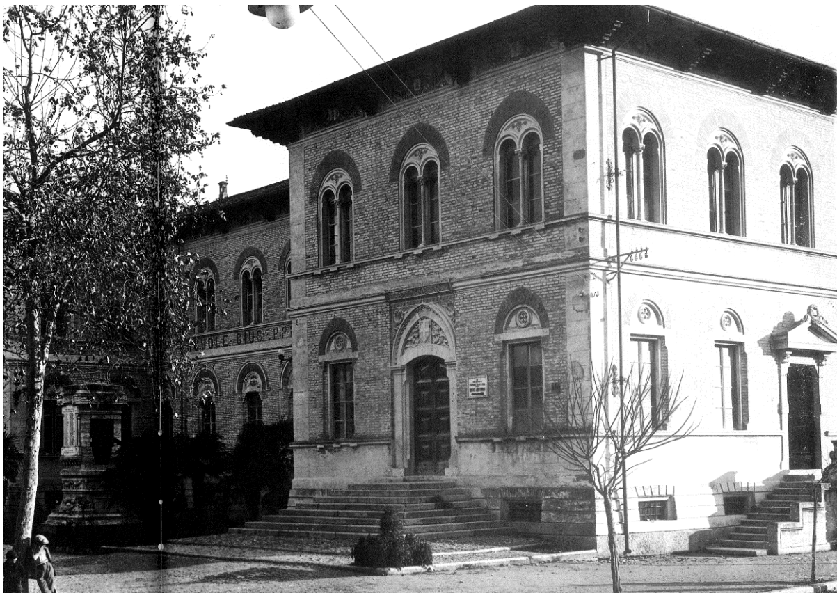
04 - Foto anni '40