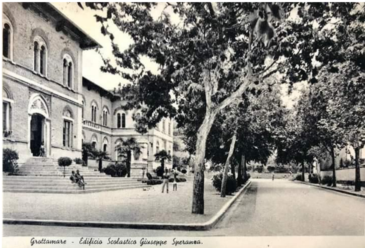
03 - Cartolina Anni '30 – Via Regina Margherita corredata da lussureggianti platani, oggi via G. Garibaldi